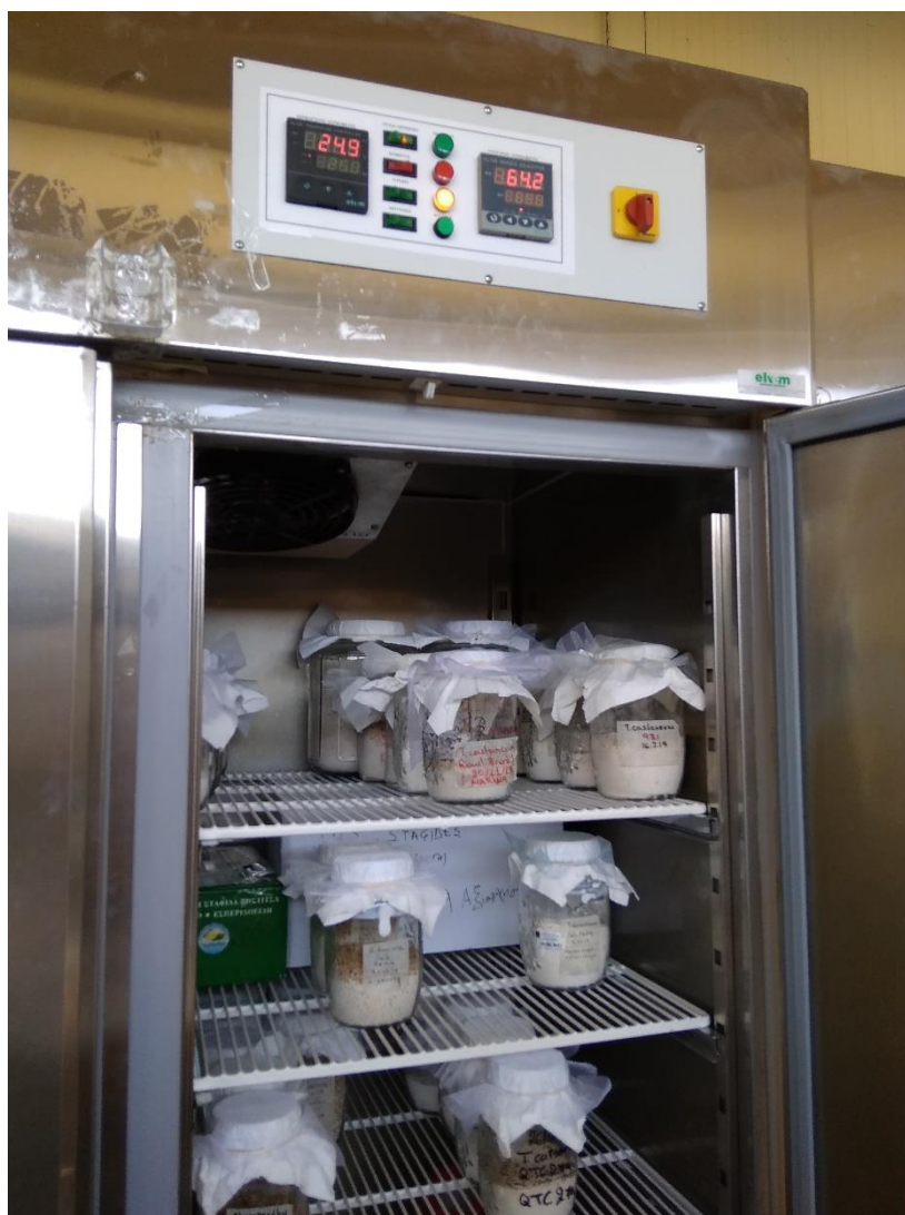
Εικόνα 14: Τοποθέτηση των δειγμάτων σε ειδικούς θαλάμους ελεγχόμενων συνθηκών για την επισημάνση της εξόδου εντόμων.

Με βάση τα αποτελέσματα των προσδιορισμών των εντόμων που αναγνωρίστηκαν στα δείγματα, βρέθηκαν 17 είδη εντόμων αποθηκευμένων προϊόντων και άλλων, και ένα είδος τρωκτικού, όπως αυτά παρουσιάζονται αναλυτικά στον Πίνακα 1.