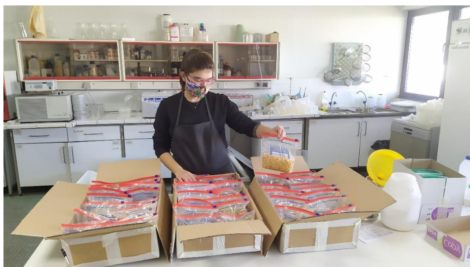
Εικόνα 10: Λήψη δειγμάτων.

Μετά τη λήψη των δειγμάτων, αυτά μεταφέρονταν άμεσα στο Εργαστήριο, προκειμένου να γίνει η καταμέτρηση των ευρεθέντων εντόμων και να ακολουθήσει ο ασφαλής προσδιορισμός τους (Εικόνα 10). Εκεί έγινε και η κατηγοριοποίηση των δειγμάτων ανά είδος προϊόντος, τρόπο αποθήκευσης, τύπο αποθηκευτικού χώρου και ημερομηνία συλλογής. Ακολουθώντας, τα δείγματα κοσκινίζονταν με ειδικά κόσκινα, με σκοπό την εύρεση ζωντανών εντόμων στο προϊόν (Εικόνα 12). Δείγματα προϊόντων αποθηκεύονταν επίσης στους θαλάμους ελεγχόμενων συνθηκών (27 °C, 50 ± 5% σχετική υγρασία) του εργαστηρίου με σκοπό την επισήμανση της εξόδου απογόνων των εντόμων μετά από χρονικό διάστημα 65 ημερών, το οποίο θεωρείται ένα ασφαλές διάστημα ώστε να εκκολαφθούν οι προνύμφες από τα αυγά που τυχόν έχουν ωοτοκήσει τα θηλυκά των περισσότερων ειδών εντόμων (Εικόνα 13-14) (Throne, 1987; Collins et al., 1989; Devi et al., 2017).