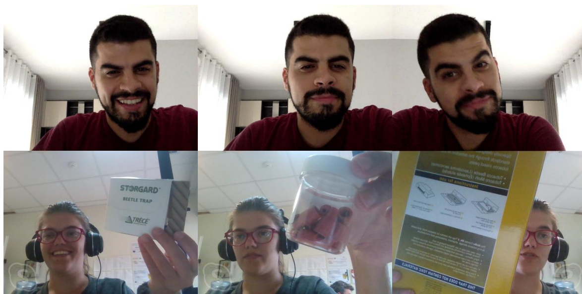
Εικόνα 19: Συνάντηση μεταξύ ερευνητών για την επιλογή των κατάλληλων τύπων παγίδων