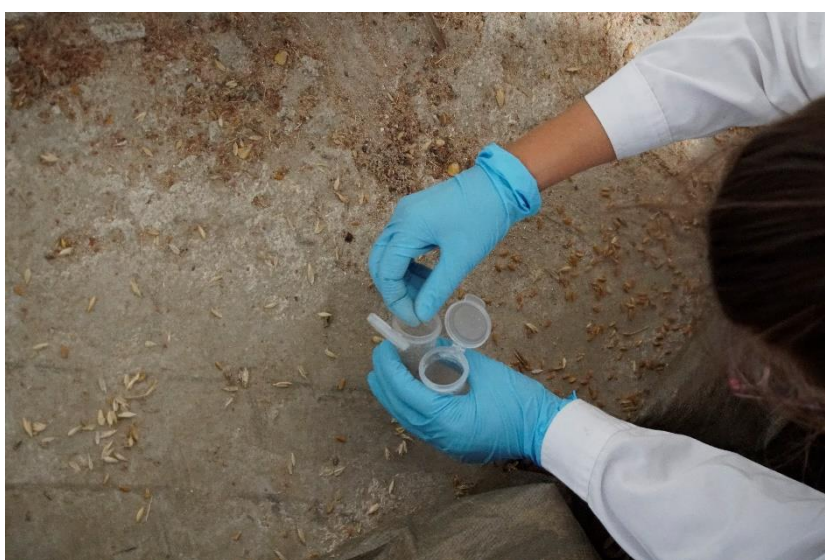
Εικόνα 8: Δειγματοληψία υπολειμμάτων προϊόντος από αποθήκη της εταιρείας Μασούτης ΑΕ.