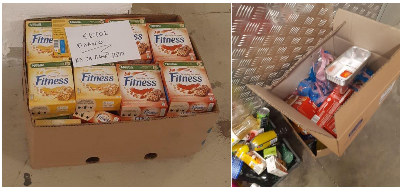
Εικόνα 1: Προσβεβλημένες μπάρες δημητριακών πριν την αποστολή τους στο εργαστήριο για περαιτέρω ανάλυση.

Παράλληλα, οι ερευνητές του ΑΠΘ ήταν ιδιαίτερα προσεκτικοί στον αριθμό των δειγμάτων που έπρεπε να ληφθούν καθώς και το μέγεθος του κάθε δείγματος, λαμβάνοντάς υπόψη τη συνολική ποσότητα των αποθηκευμένων προϊόντων, τον αριθμό των διαφόρων παρτίδων, την μορφή της συσκευασίας κ.α. Η σωστή εκτίμηση του αριθμού των δειγμάτων που πρέπει να ληφθούν είναι απαραίτητη για τη σωστή εκτίμηση του πληθυσμού των εντόμων που βρίσκονται στο προϊόν και ακολούθως τη λήψη των ορθών αποφάσεων όσον αφορά τα κατασταλτικά μέτρα που πιθανώς θα πρέπει να ακολουθηθούν (Clark et al., 1967). Προκειμένου να σχηματιστεί μια πλήρης εικόνα για την παρουσία των διαφόρων ειδών εντόμων στους χώρους της εταιρίας, πραγματοποιήθηκαν δειγματοληψίες από όλους τους τύπους αποθηκευτικών χώρων που διαθέτει η εταιρία, από την παραλαβή των προϊόντων τροφίμων μέχρι την τελική πώλησή τους (Εικόνα 9).