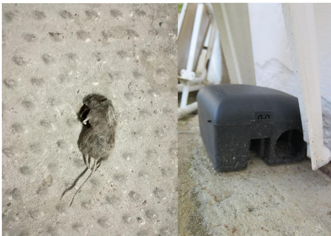
Εικόνα 7: Έλεγχος των ήδη υπαρχόντων παγίδων τρωκτικών σε αποθήκες της εταιρείας και συλλογή δειγμάτων από τους χώρους αυτούς.