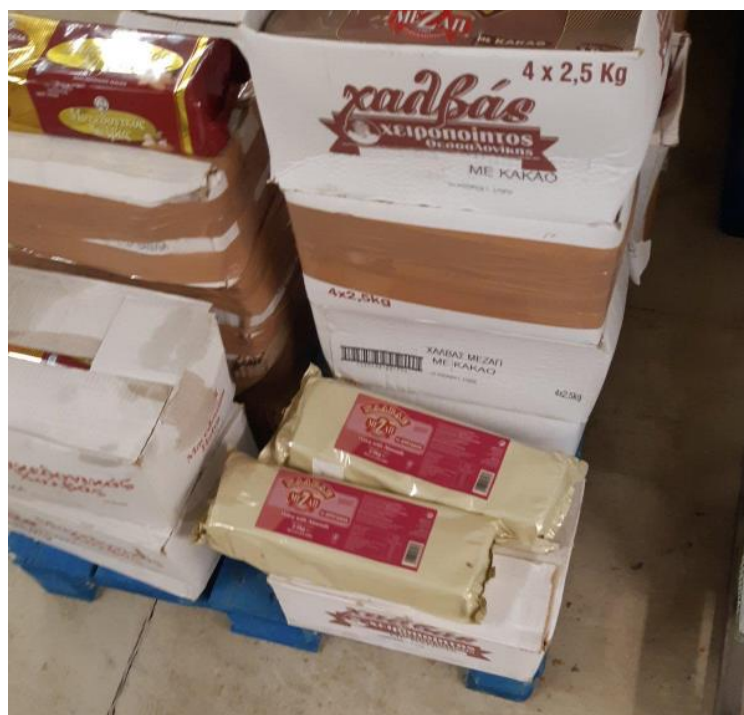
Εικόνα 3: Συλλογή τυχαίων συσκευασιών από παρτίδες προϊόντων για περαιτέρω ανάλυση από την ερευνητική ομάδα του ΑΠΘ.