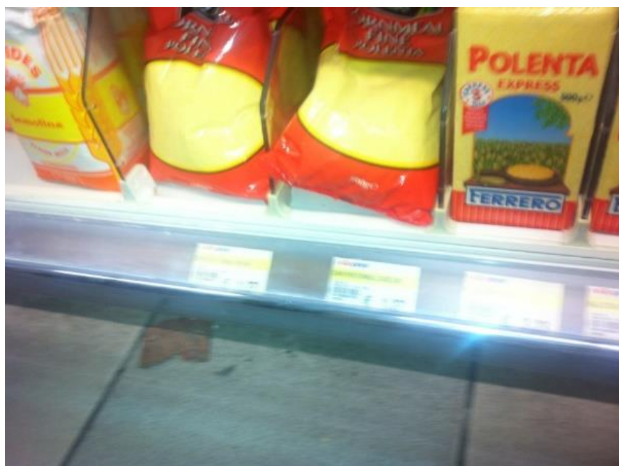
Εικόνα9: Επιθεώρηση όλων των αποθηκευτικών χώρων της εταιρείας Μασούτης ΑΕ, από την παραλαβή των προϊόντων τροφίμων μέχρι την τελική πώλησή τους.