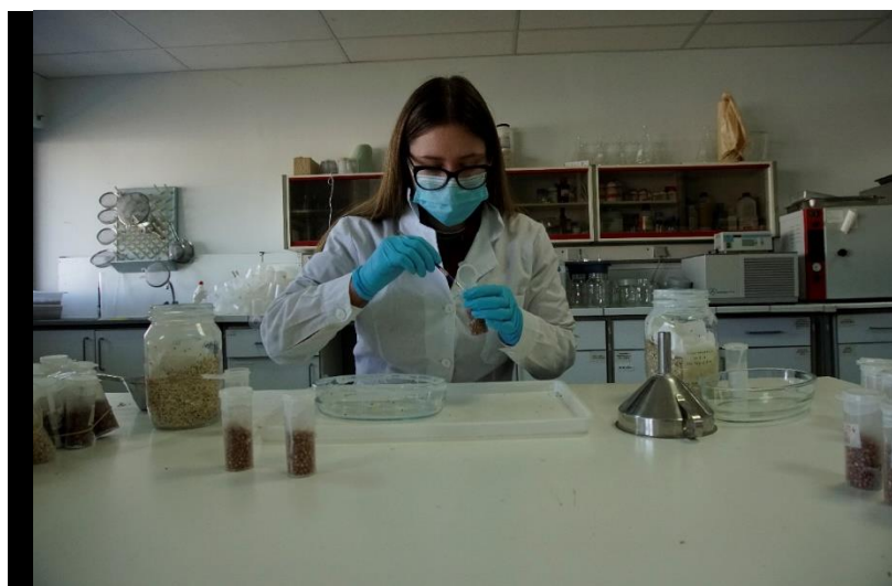
Εικόνα 13: Προετοιμασία των δειγμάτων για την επισήμανση της εξόδου εντόμων.