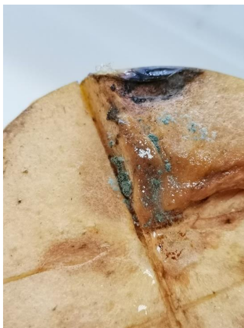
Εικόνα 5: Τεμάχιο νωπού προϊόντος προσβεβλημένου από παθογόνα.