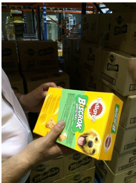
Εικόνα 2: Επιτόπια επιθεώρηση συσκευασιών για προσβολές.