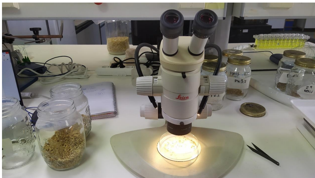
Εικόνα 11: Αναγνώριση εντόμων με τη βοήθεια στερεοσκοπίου.

Gorham J.R. (1991). Insect and Mite Pests in Food – An illustrated key, Volume 1 & 2. Agriculture Handbook No 655, United States Department of Agriculture, Food and Drug Administration, Washington D.C.