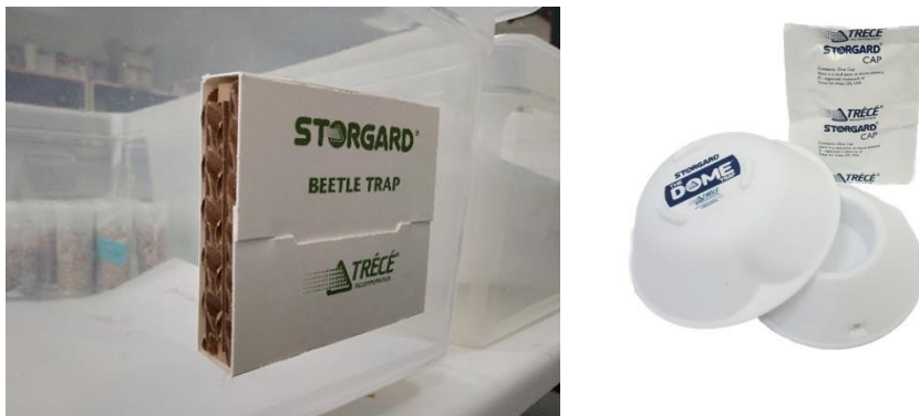
Εικόνα 16: Διάφοροι τύποι παγίδων που μοιάζουν με καταφύγια