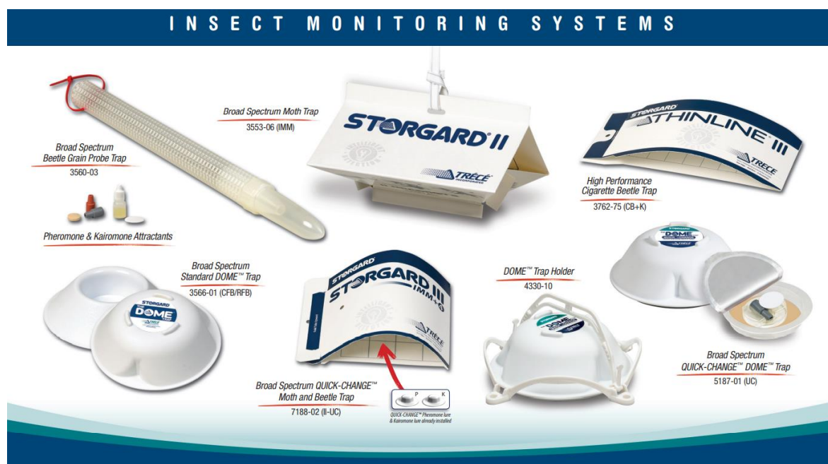
Εικόνα 18: Εμπορικοί τύποι εξειδικευμένων παγίδων

Έπειτα, ακολούθησε η στενή συνεργασία των ερευνητών του ΑΠΘ και της εταιρείας για την κατανόηση των αναγκών που πρέπει να καλυφθούν από τα δίκτυα παγίδευσης, όπως για παράδειγμα, η επιλογή του κατάλληλου τύπου παγίδας για την κάλυψη/σύλληψη των κυριότερων εντόμων στα οποία βασίζονται οι επιστροφές (κολεόπτερα), η καταγραφή των συλλήψεων με ορθό τρόπο από τις συσκευές παγίδευσης (π.χ. δίπτερα, λεπιδόπτερα), ο ορθός χωροτακτικός σχεδιασμός και τοποθέτηση των παγίδων στην Μασούτης ΑΕ., κα. Η συνεργασία μεταξύ των δυο εργαστηρίων αποτέλεσε και τον ακρογωνιαίο λίθο στον μετέπειτα σχεδιασμό και δημιουργία εξατομικευμένων για την εταιρία παγίδων παρακολούθησης εντόμων αποθηκών και τρωκτικών.