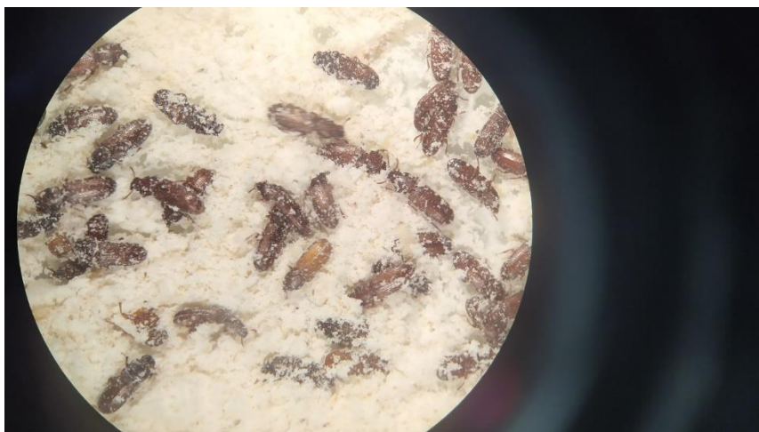
Εικόνα 12: Ακμαία έντομα του γένους Tribolium , κατά την αναγνώρισή τους με τη βοήθεια στερεοσκοπίου.