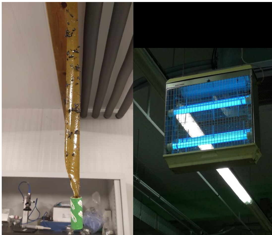
Εικόνα 6: Έλεγχος των ήδη υπαρχόντων παγίδων διπτέρων σε αποθήκη της εταιρείας Μασούτης ΑΕ και συλλογή δειγμάτων για περαιτέρω εργαστηριακή ανάλυση.