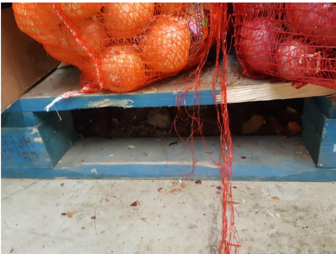
Εικόνα 3β: Διάφορα σημεία των εγκαταστάσεων της εταιρείας στα οποία βρέθηκαν οργανικά υπολείμματα.