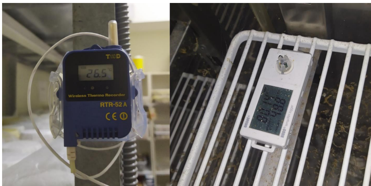
Εικόνα 9: Διάφοροι μετρητές θερμοκρασίας και σχετικής υγρασίας