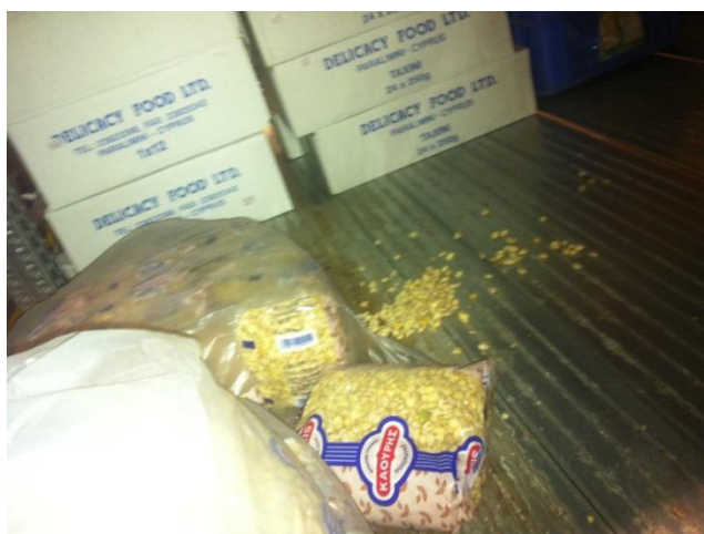
Εικόνα 6: Ανοιγμένες συσκευασίες προϊόντων.