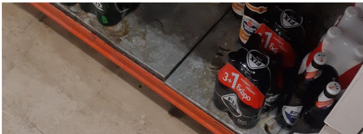
Εικόνα 2: Διάφορα σημεία των εγκαταστάσεων της εταιρείας που δυσχεραίνουν την καθαριότητά τους από το προσωπικό.