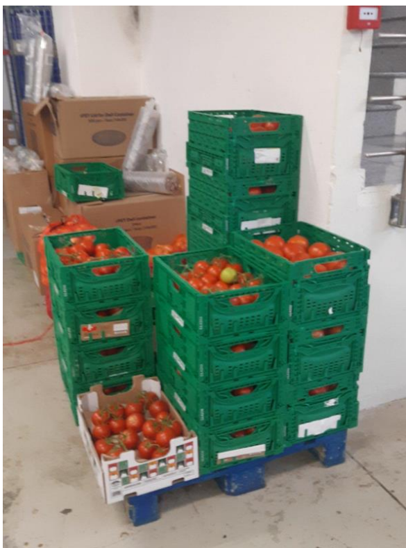
Εικόνα 5: Ελλιπής συσκευασία προϊόντων για την αποτροπή εισόδου εντόμων σε αυτά