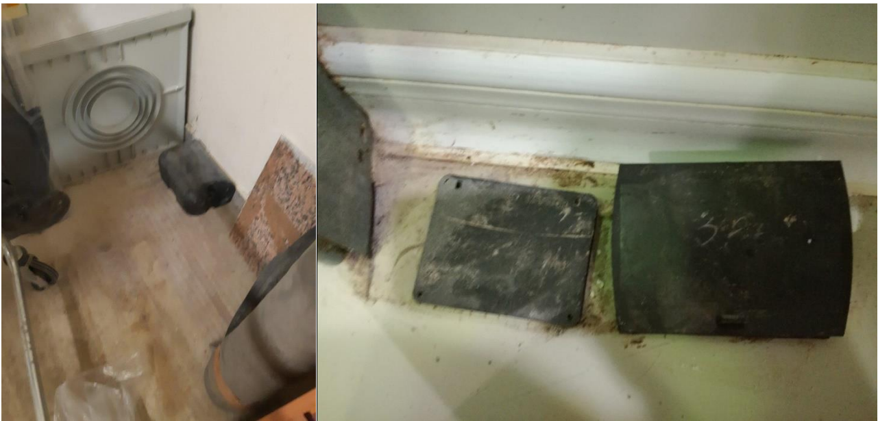
Εικόνα 7: Τοποθέτηση παγίδας τρωκτικών σε λανθασμένο σημείο.

Από την άλλη πλευρά, κάποιες παγίδες είχαν τοποθετηθεί σε λάθος σημεία μέσα στους χώρους. Ειδικότερα, κατά την αυτοψία καταγράφηκαν περιπτώσεις λανθασμένης χρήσης και τοποθέτησης δολωματικών σταθμών και δολωμάτων για μυοκτονία. Ενδεικτικά, η έξοδος κάποιων δολωματικών σταθμών ήταν μπλοκαρισμένη από άλλα αντικείμενα εμποδίζοντας την σωστή λειτουργία τους, ενώ σε ορισμένους δολωματικούς σταθμούς δεν υπήρχαν τα δολώματα (Εικόνα 7). Το ίδιο ισχύει και για τις παγίδες φωτός οι οποίες δεν πρέπει να τοποθετούνται πάνω από τις πόρτες ή σε σημεία που υπάρχει δυνατό φως.