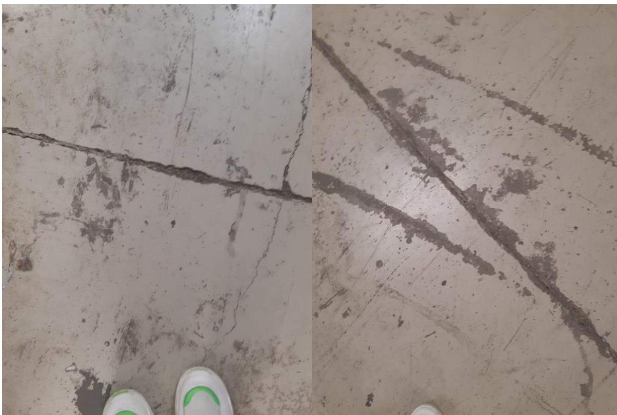
Εικόνα 4: Διάφορα σημεία στο δάπεδο που δυσχεραίνουν την καθαριότητά τους από το προσωπικό.