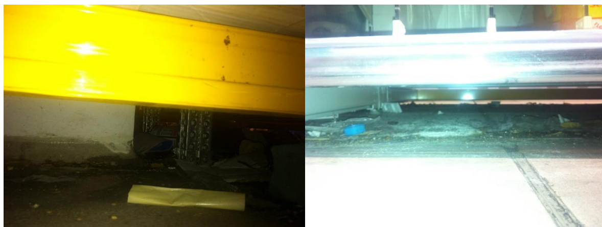
Εικόνα 3α: Διάφορα σημεία των εγκαταστάσεων της εταιρείας στα οποία βρέθηκαν οργανικά υπολείμματα.